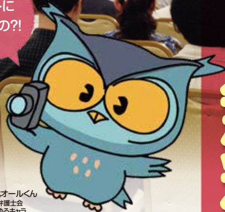
可視化オールくん 兵庫県弁護士会 可視化ゆるキャラ