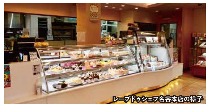
レーブドゥシェフ名谷本店の様子