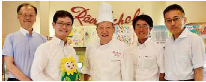
佐野会長(中央)と当会広報委員会メンバー

した。独立するとき、資金を出すとのオファーもありましたが、自分が育った神戸で店を出したいと考えていました。当時、僕が作っていたお菓子はけっこう先端のもので、神戸なら新しいものを理解してくれる。街の土壌というか、消費者が理解してくれないと、お菓子を売っていくのは難しいですからね。