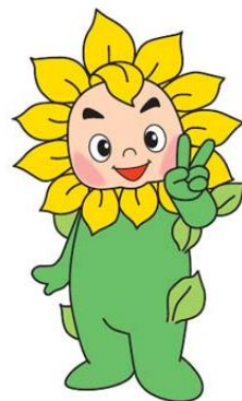
兵庫県弁護士会 イメージキャラクター ヒマリオン